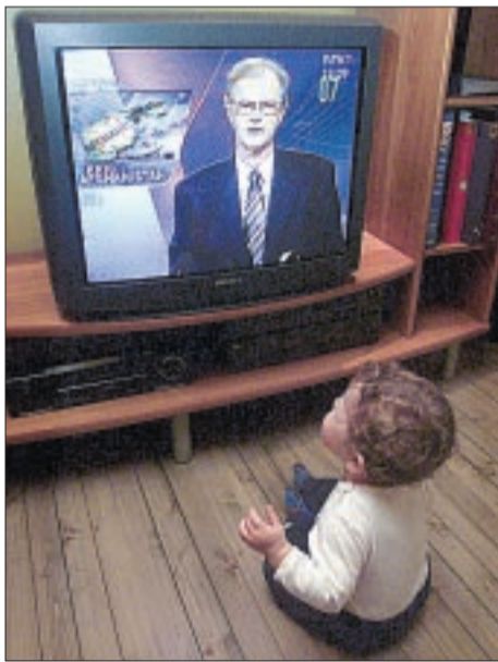
DET FARLIGE FJERNSYNET. KrFs oppfatning av de levende bildenes magi har fått slå gjennom i regjeringens forslag til ny paragraf 100 i Grunnloven.

Det som har skjedd her, er åpenbart at Kristelig Folkeparti stort sett har fått det som det vil. Midt i alt snakket om islamisme er dette et eksempel på hvordan vi kan oppleve religiøst begrunnede begrensninger i demokratiske fri- og rettigheter også i vår del av verden. Det er det kristelige partiets oppfatning av de levende bildenes magi som får slå gjennom i tanken om spesialbehandling av audiovisuel-